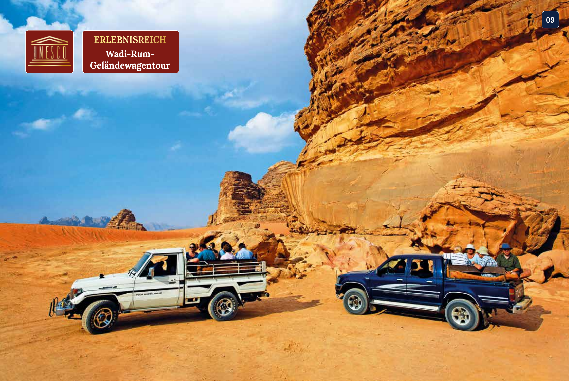
Am Morgen verteilen wir uns auf mehrere offene Geländewagen und fahren in Begleitung jordanischer Beduinen durch die Wüste